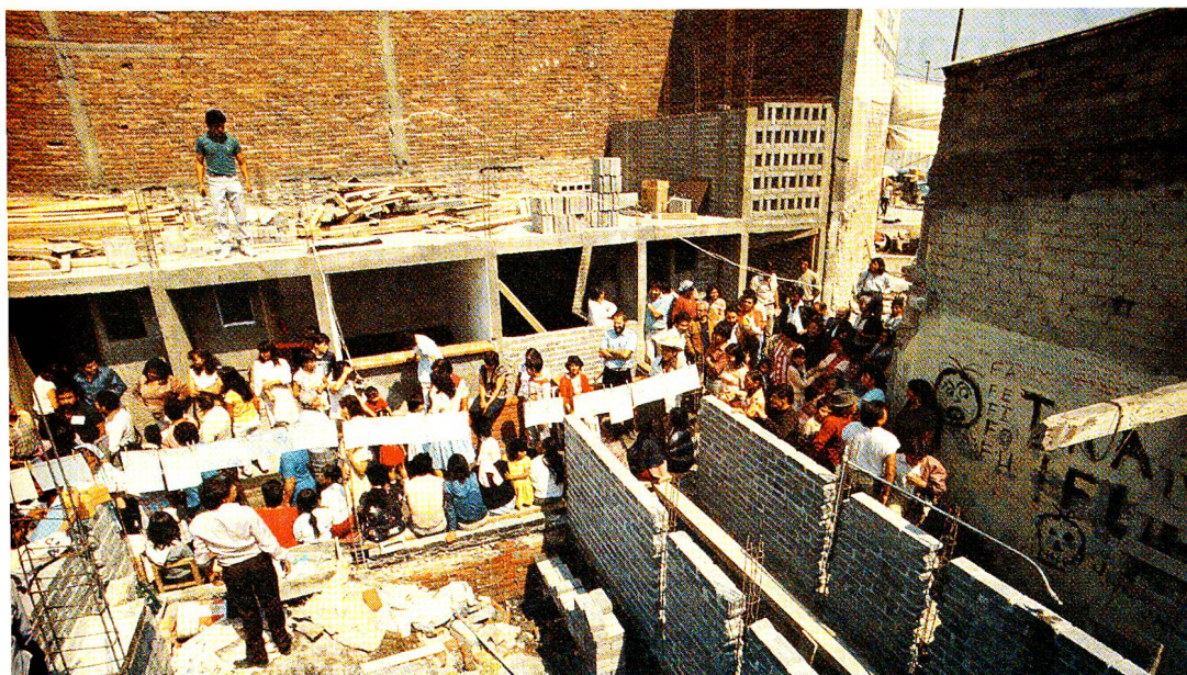
Das Erdbeben vom 19. und 20. September 1986 zwang sogar grosse Häuser in die Knie...

... doch das mexikanische Volk ist unzerstörbar. Angespornt durch eine internationale Hilfswelle, hat es in der Zwischenzeit bereits wieder mit dem Wiederaufbau begonnen.