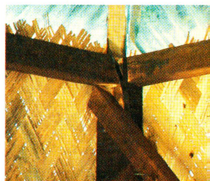
Es wurde mit vertrautem, einheimischem Material gearbeitet, zum Beispiel hier mit Bambusblättern.

deren Art von Einkommenssicherung. Der unsichere Tagelohn wird etwa durch den Verkauf von selbst hergestellten Produkten ersetzt. Bevor man mit der Arbeit anfängt, ist es deshalb nötig, zu eruiieren, ob die Informationen über das Programm in den einzelnen Familien weitergegeben werden, ob also die Männer, das was sie auf dem Basar oder an einem Treffen gehört und gelernt haben, ihren Frauen auch weitergeben.