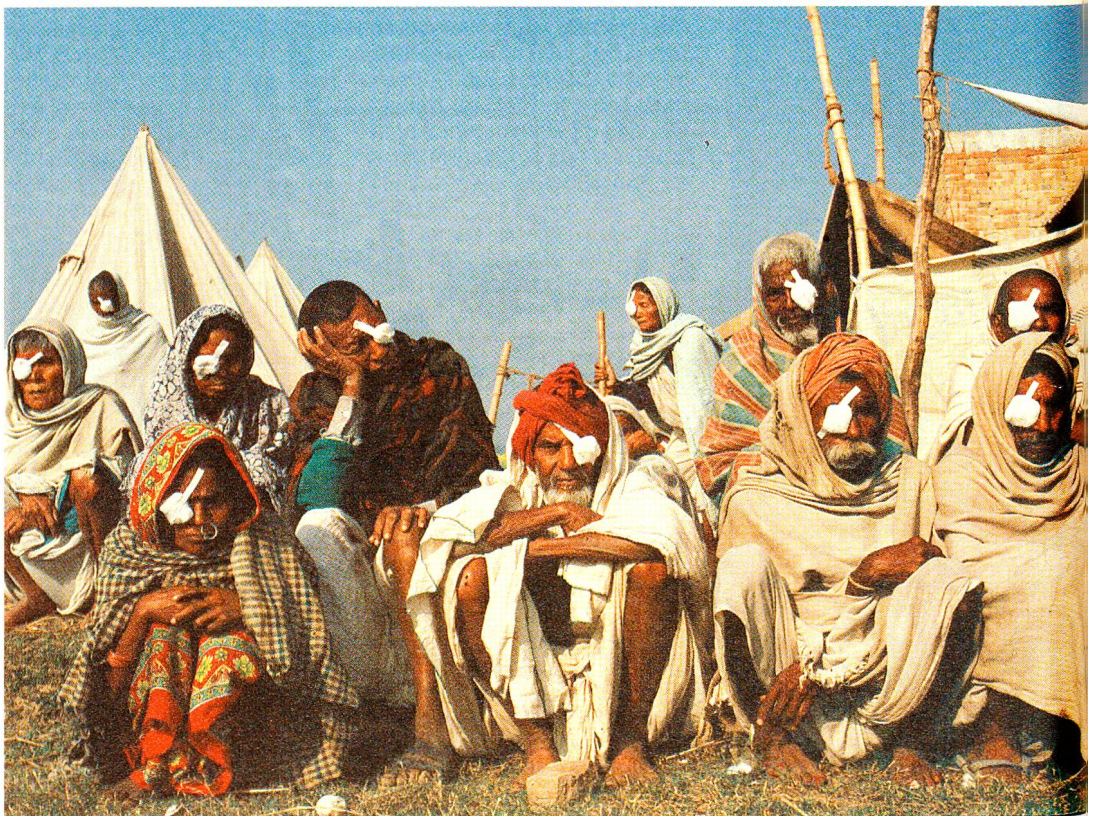
Unzähligen Menschen mit schweren Augenleiden kann durch das augenärztliche Projekt des SRK geholfen werden. Wenn die ambulante Equipe unterwegs ist, kommen Hunderte von Menschen aus weit abgelegenen Dörfern in den Bergen ins «Lazarett», um sich helfen zu lassen.

«Diese Restkosten für den Spitalbau müssen wir selbst übernehmen. Ich werde mich darum kümmern und suche das Geld hier. Wie lange können wir auf ausländische Hilfe zurückgreifen? Wir sollten doch nicht immer euch um Unterstützung bitten. Wenn wir nicht bald etwas in die Wege leiten, werden wir nie unabhängig sein.» Dies ist eine der vielen träfen und manchmal