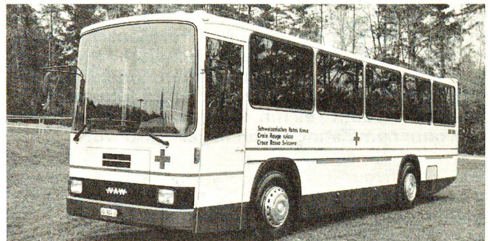
Der neue Car bietet Platz für 30 Personen oder 20 Passagiere im Rollstuhl.