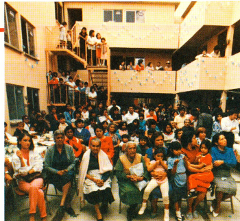
Nach getaner Arbeit wird gefeiert. In Mexiko D.F. wurden in diesen Wochen zahlreiche vom SRK finanzierte «Vecindades» eingeweiht.

gliederorganisationen vereinigt, die mit Geschädigten zusammenarbeiten. Durch diese Vorgehensweise liess sich zum Teil sehr günstige Preise erzielen. So kam der niedrigste Quadratmeterpreis in Mexiko D.F. auf 63 – 70 US-Dollar zu stehen. Etwas höhere Preise bewegten sich zwischen 78 – 95 und 103 – 108 Dollar. Als Vergleich: Das staatliche Wiederaufbauprogramm – der mexikanische Staat hat (in Rekordzeit) 44 000 Wohnungen gebaut – rechnet mit Quadratmeterpreisen von 250 – 280 Dollar. Die staatlichen Wohnungen belasten ihre Bewohner denn auch mit einer Miete, die 30% des Mindestlohnes ausmacht, was enorm viel ist, wenn man bedenkt, dass für Einkommensschwache die Mieten in Mexi-