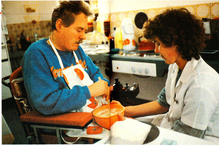
Die Ergotherapeutin übt mit dem Patienten anhand alltäglicher Tätigkeiten neue Bewegungs- und Arbeitsabläufe ein.

Die Therapie versucht, die Gedanken des Patienten vom Kreisen um sich selber und von seinem Leiden wegzulen-