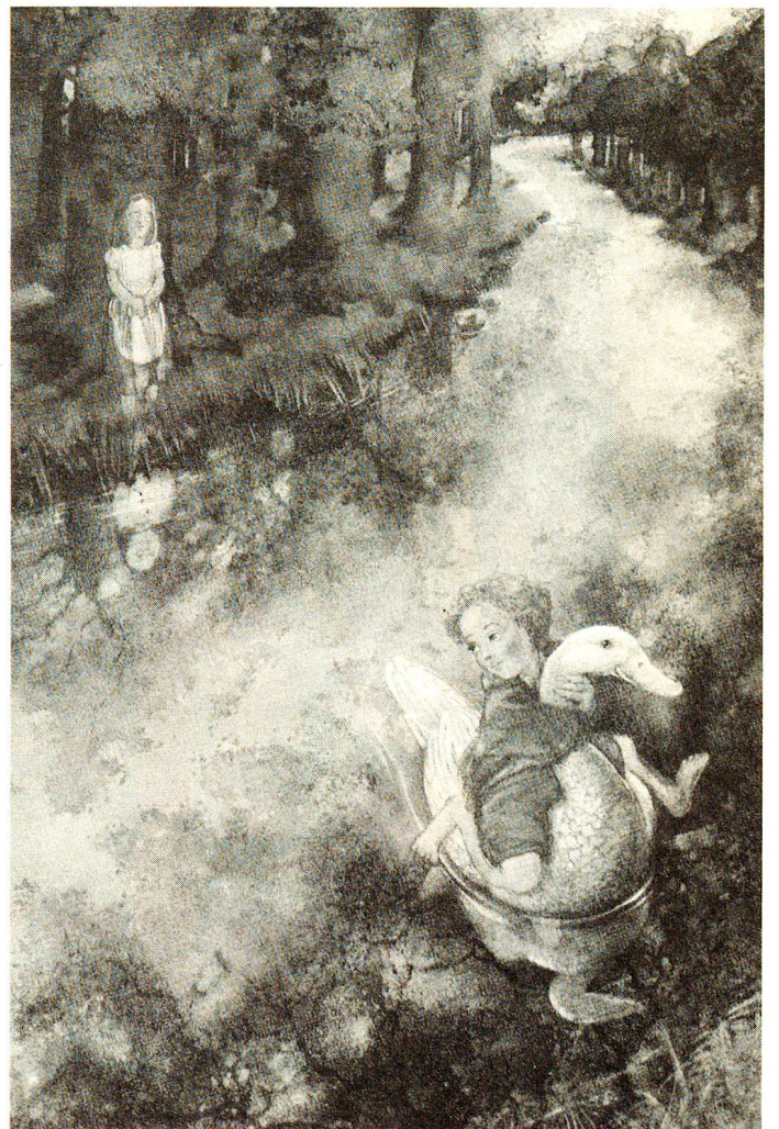
«Eines Tages möchten die kleinen Mädchen aus ihrem behüteten Tal ausbrechen...»

Einige von Monique Félix illustrierte Kinderbücher sind auf Deutsch erschienen, so «Hänsel und Gretel» (Verlag Middelhauve, Köln), «In diesem Buch steckt eine Maus» und «Was macht die kleine Maus am Meer?» (Verlag Jungbrunnen, Wien) sowie verschiedene Bücher über das Leben der Natur (Insel-Verlag, Frankfurt).