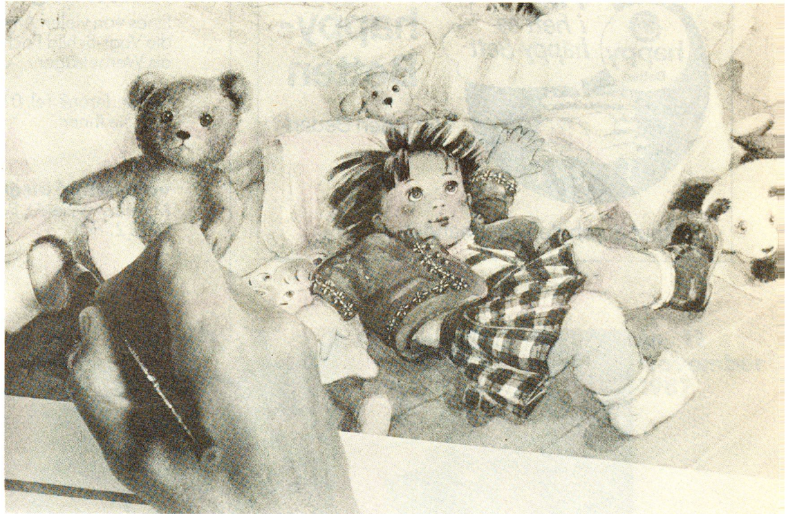
Kinderbüchern gilt ihre grosse Liebe. Sie verarbeitet darin auch autobiographische Erlebnisse.

Es scheint kein Zufall, dass Monique Félix Amnesty Inter-