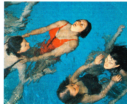
Eine Einführung in das Rettungsschwimmen stand ebenfalls auf dem Programm.

Nach der Arbeit das Vergnügen: die Jugendrotkreuzgruppe aus Spanien am Unterhaltungsabend.