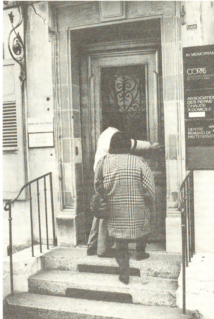
Das Haus an der Avenue de Rumine Nr. 2 in Lausanne: ein Reisebüro besonderer Art.

Die einen halten die Ungewissheit nicht mehr länger aus, die anderen wurden abgewiesen – viele ehemalige Asylbewerber verlassen die Schweiz und ihr verlorenes Paradies, um in ihre Heimat zurückzukehren oder in einem anderen Land Asyl zu suchen. Starthilfe leistet ihnen dabei ein Reisebüro ganz besonderer Art: eine Beratungsstelle des Schweizerischen Roten Kreuzes.