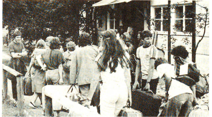
Lenk 1982. Ankunft vor den Lenker Militärbaracken. Während 17 Jahren wurden in Lenk Schnupperlehr-Lager durchgeführt.

ist.» Im Westschweizer Lager machten immer wieder auch Tessiner Jugendliche mit. Jetzt benötigen sie für eine Teilnahme Deutschkenntnisse.