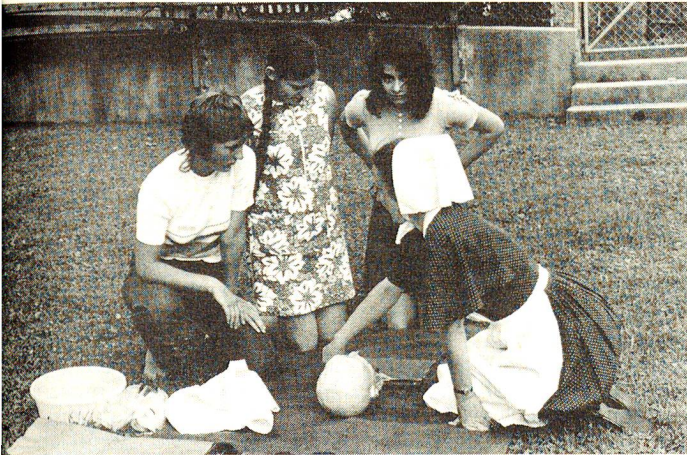
St. Stephan 1970 und 1971. Weisse Schürzen, Schwestern- und Ordenstrachten prägten damals das Bild.