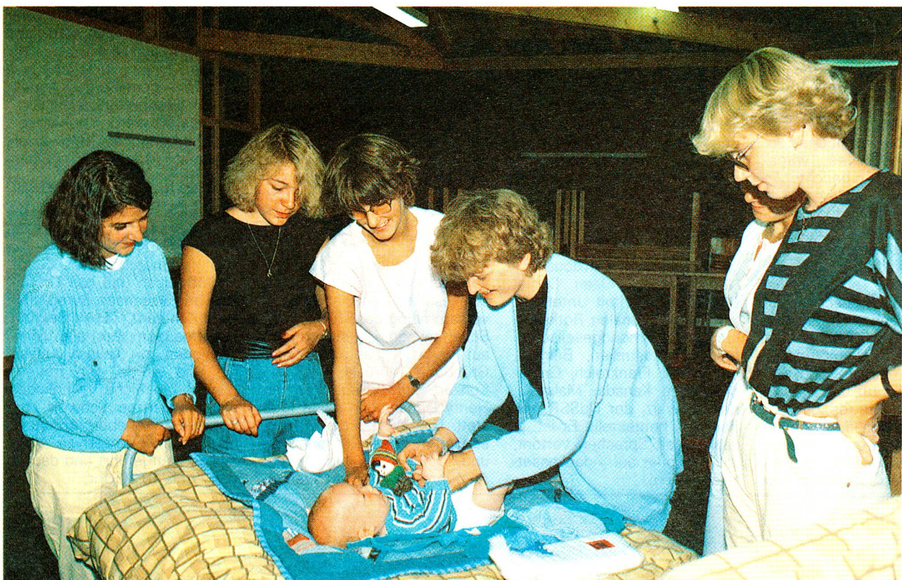
Lenk 1985. Immer noch der meistgeäusserte Wunsch: Babys versorgen. Im Spital ist das aber heute kaum mehr der Fall.

Allerdings müssen sie sie auch mit der Realität bekannt machen. Noch heute haben drei Viertel der 15- bis 16jähri-