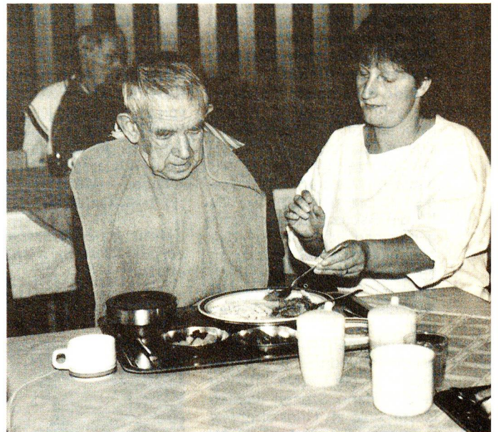
Im Pflegeheim hilft die Pflegehelferin bei alltäglichen Verrichtungen. Wichtig und für beide Seiten bereichernd ist aber auch die seelische Zuwendung.