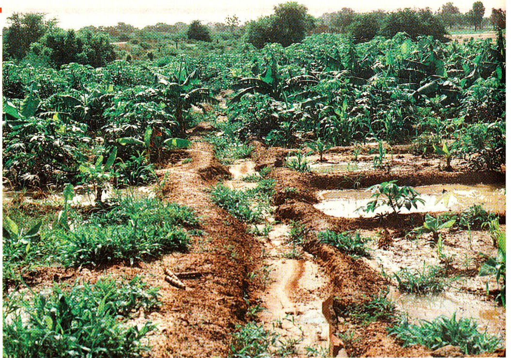
2,5 Hektaren fruchtbares Ackerland konnte das Rotkreuzkomitee in Koulikoro 25 armen Familien zugänglich machen. Die einzelnen Parzellen werden in regelmässiger Turnus mit Wasser aus dem Niger bewässert.

Morry Diarra und seine 14köpfige Familie müssen offensichtlich hart und ausdauernd arbeiten, um überleben zu können. Wenn die Regenzeit, die sich vor kurzem mit ersten Güssen angekündigt