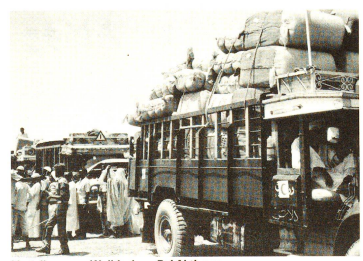
Verteilung von Wollecken: Bei Aktionen dieser Art ist die Atmosphäre äusserst gespannt. Damit die Situation nicht ausser Kontrolle gerät, sind eine straffe Organisation und zügige, gewissenhafte Arbeit ausserordentlich wichtig.

Jene, die es schaffen, bis nach Khartum zu kommen, siedeln sich in den Randgebieten der Hauptstadt an und warten darauf, von der Regie-