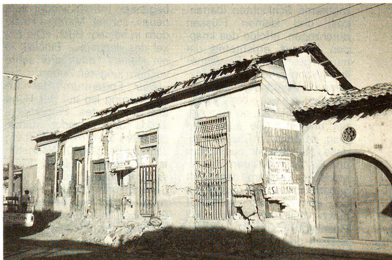
Ein «meson» in der Altstadt von San Salvador. «Mesones» waren früher Herrschaftshäuser. Heute werden sie oft von Dutzenden von Menschen bewohnt.

In der ungelösten sozialen und politischen Frage wurzelt auch der Konflikt zwischen der Armee und der bewaffneten Opposition der Befreiungsfront «Farabundo Martí de Liberación Nacional» FMLN, der in den letzten Jahren über 60 000 Tote gefordert hat. Die Zivilbevölkerung wurde dabei