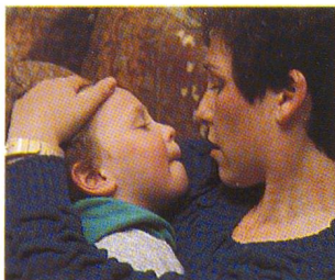
Die dramatische Geschichte des kleinen Micky. Seite 46.