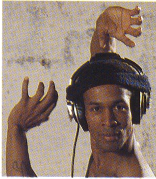
Ein Tänzer im Training. Er lauscht dem «Klang des Lebens». Titelgeschichte. Seite 6.