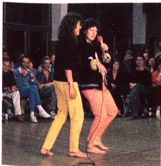
«Ich fühle mich spannender.» Ein Teilnehmer am Forum über Beziehungen, geleitet von einer Gründerin der Erotischen Akademie. Erlebnisbericht. Seite 21.