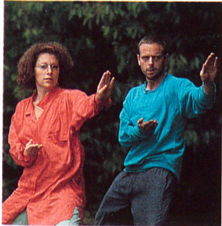
«Wir kämpfen parallel.» Ein Ehepaar, das seine Aggressionen nicht unterdrückt, sondern in einem ritualisierten Kampferspürt und auslebt. Titelgeschichte. Seite 4.