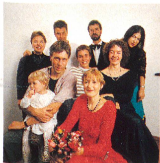
Vor dem Lächeln die Krisen. Eine «neu zusammengesetzte» Familie entsteht aus Konflikten, Trennungen, Tränen. Titelgeschichte. Seite 4.