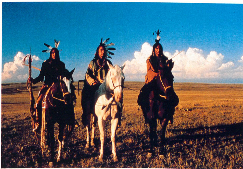
MONOPOLE PATHÉ FILMS