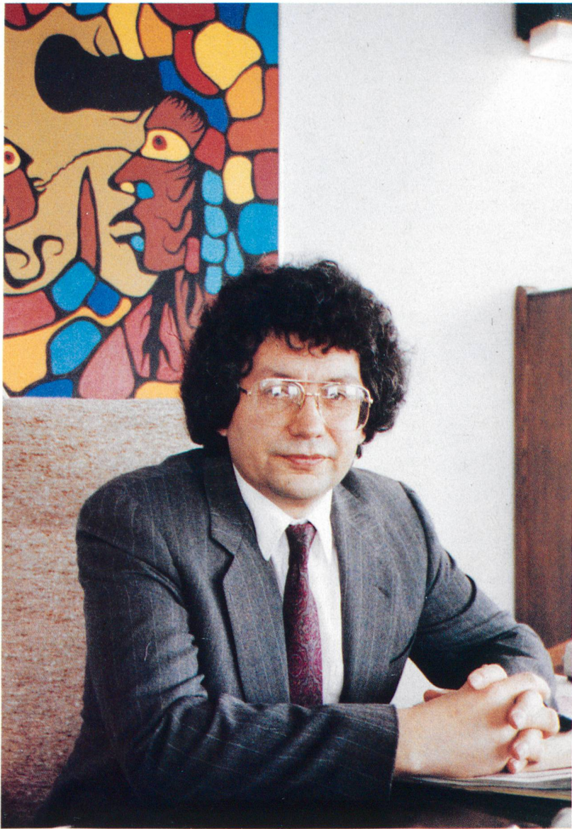
Häuptling Georges Erasmus, Chief of Chiefs

A ctio Humana: Georges Erasmus, Sie sind Oberhaupt der Versammlung der Ersten Nationen, der Organisation der grossen Indianer- und Eskimostämme Kanadas. Inwiefern unterscheidet sich die Arbeit Ihrer Organisation von jener anderer grosser Organisationen? Welches ist ihre «kulturelle» Einmaligkeit, und wo hat sie ihre Wurzeln?