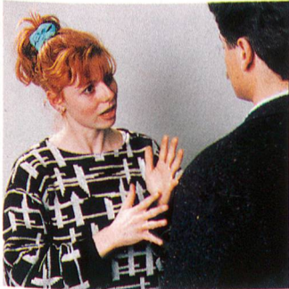
Gebärden statt Worte. Die Sprache der Gehörlosen emanzipiert sich – ein Gewinn auch für die Hörenden. Titelgeschichte. Seite 6