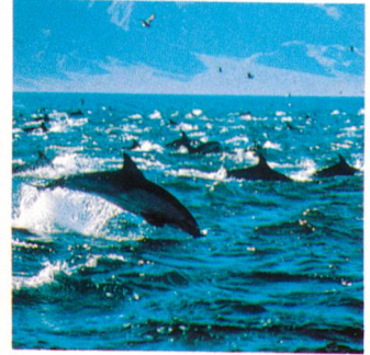
Delphine sind geborene Unterhalter. Jim Nollman forderte sie zum Tanzen auf. Sie liessen sich nicht lange bitten. Erlebnisbericht. Seite 30