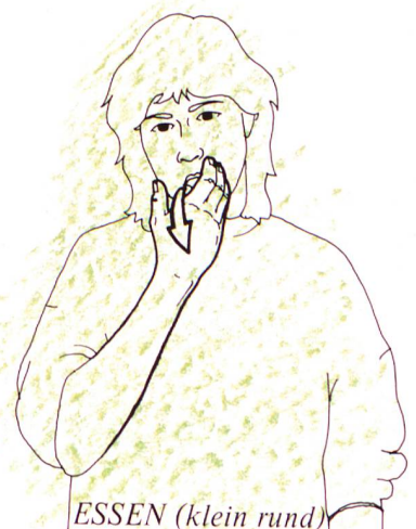
ESSEN (klein rund)