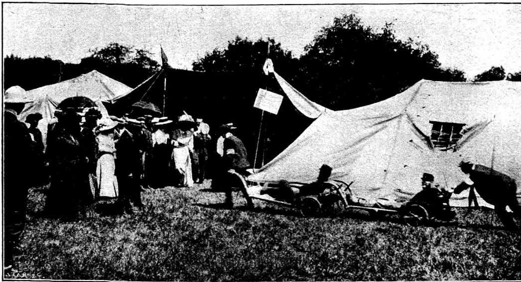
Les tentes montées par les samaritains de Genève, lors de l'exercice du 29 juin

Le cantonnement des samaritains comprenait en outre une cuisine volante dont MM. Buisson et La Chapelle étaient les maîtres-coq. Ils méritent de sincères félicitations; ils ont su préparer un excellent