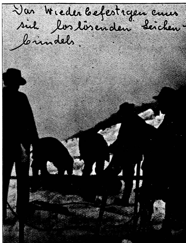
Fig. 3 — Vérification du paquetage d'un sinistré

Le dernier cliché (fig. 4) nous fait voir — comme à travers une lunette d'ap-