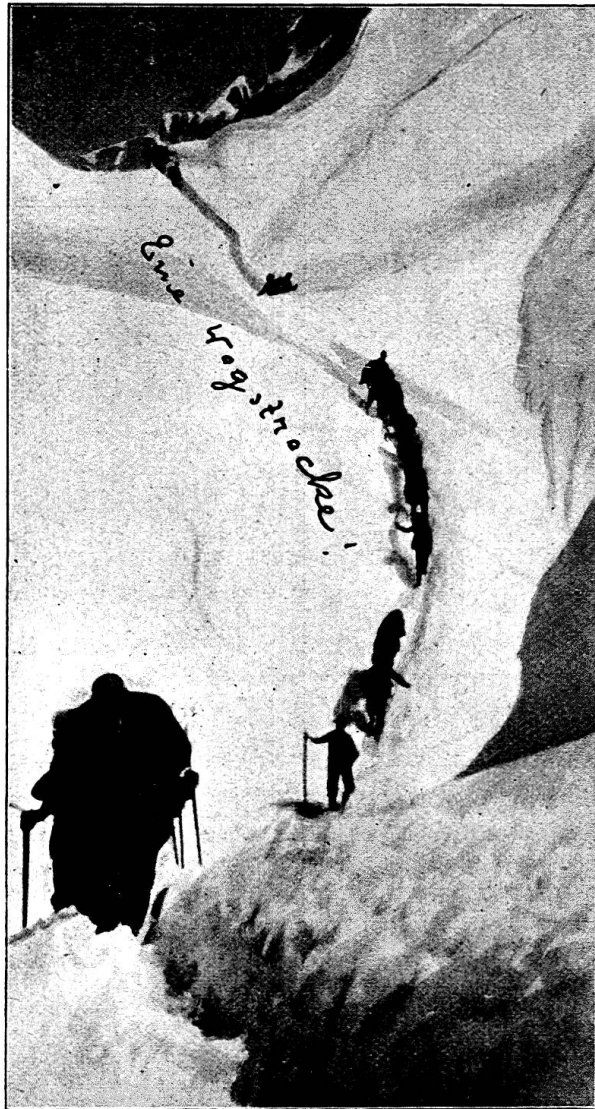
Fig. 4 — Convoi de six cadavres portés par des guides

Puis c'est la descente en chemin de fer jusqu'à Grindelwald; les cadavres cou-