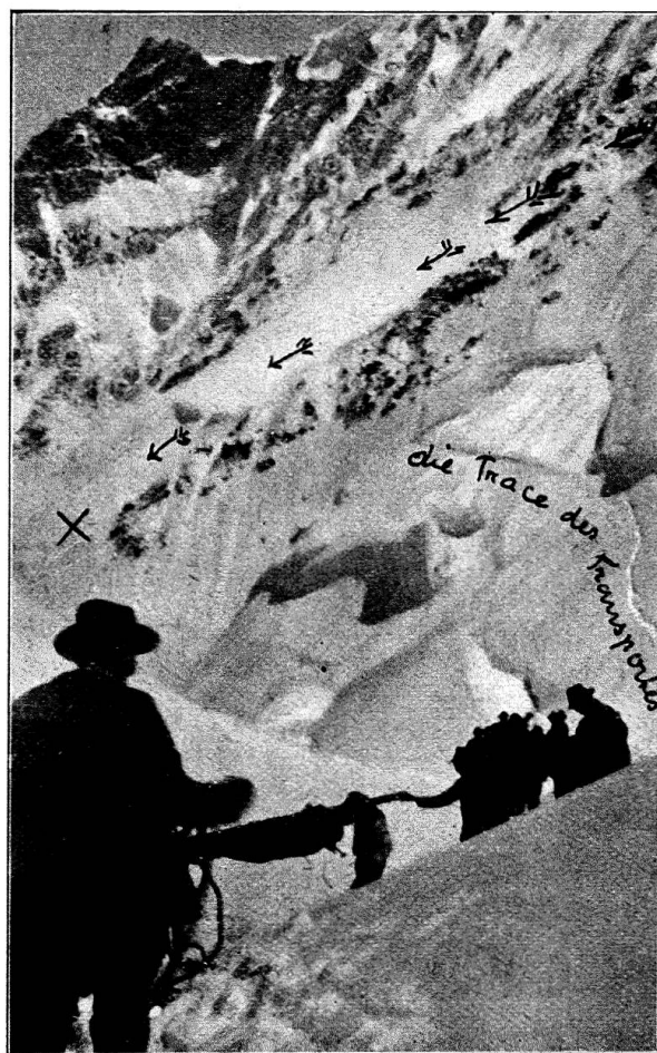
Fig. 2 — Catastrophe du Bergli (1910); trajet de l'avalanche et tracé du chemin parcouru par le convoi.

ressentent durement les cahots du chemin et la cadence de la marche des porteurs; mais c'est ainsi seulement que les guides — encordés par prudence à d'autres camarades — peuvent conserver libres leurs bras, se servir du piolet et de leurs mains. C'est ce que nous voyons sur la fig. 1.