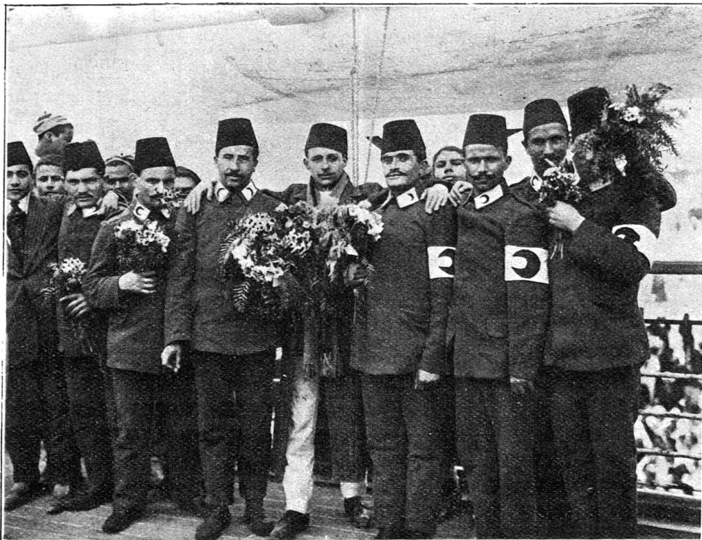
Avant leur départ pour le théâtre des hostilités, les membres du Croissant-Rouge sont couverts de fleurs apportées par leurs frères tunisiens