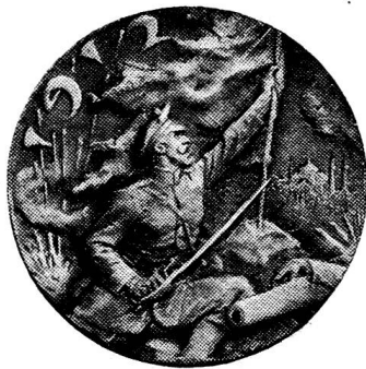
MÉDAILLE COMMÉMORATIVE DE LA GUERRE DES BALKANS