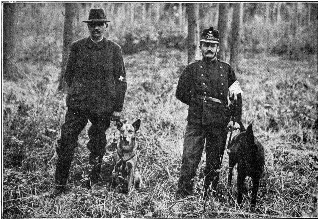
Les chiens sont prêts au départ et vont chercher des blessés dans la forêt

qu'on a retrouvés plusieurs jours après les batailles, et leurs récits prouvent qu'une inspection plus détaillée du terrain