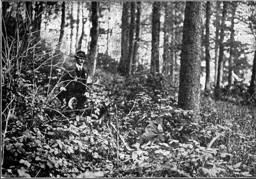
Un autre blessé découvert en forêt par un chien sanitaire

Nous sommes heureux de pouvoir mettre sous les yeux de nos lecteurs un certain nombre de photographies prises lors du « Concours de chiens militaires » qui a eu