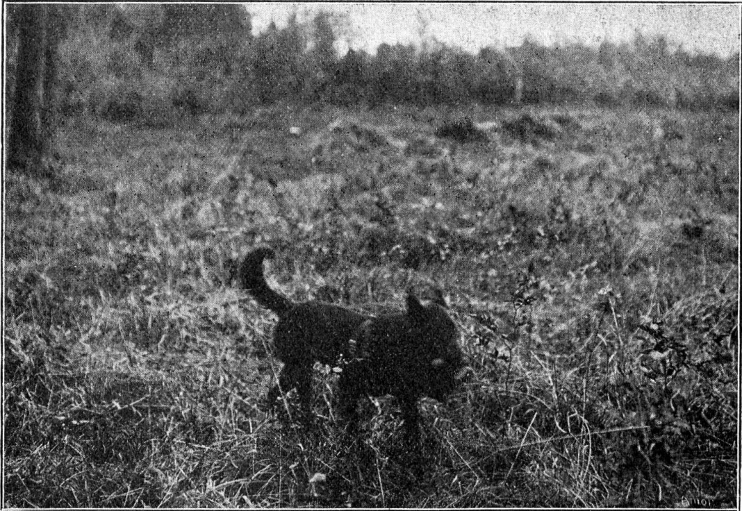
„Hector” apporte le képi qu'il a enlevé à un blessé et vient le déposer aux pieds de son maître

de telle ou telle opération militaire, aurait fait découvrir des blessés, morts dès lors faute de soins.