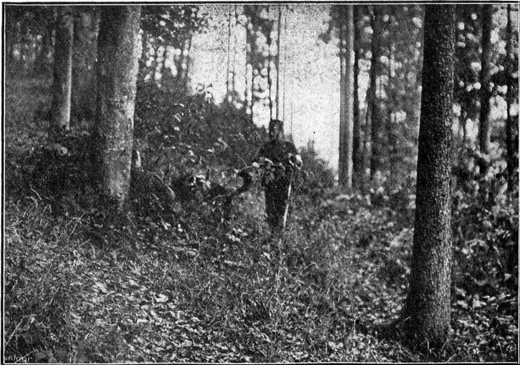
Le chien conduit son maître auprès du blessé, dont il vient d'apporter le képi

Des équipes de brancardiers accompagnés de chiens sanitaires auraient rendu bien des services, et il est à souhaiter que