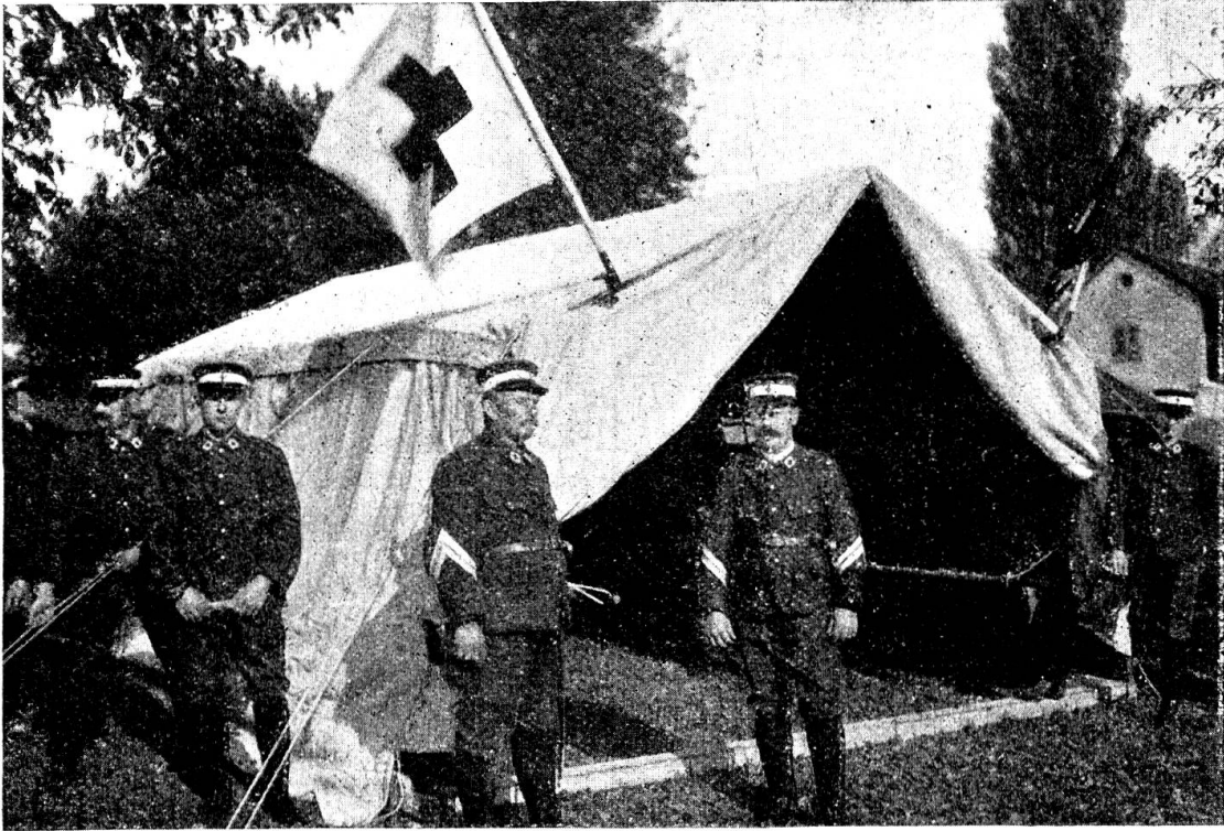
La tente bâloise, montée par les hommes de la colonne de la Croix-Rouge de Bâle, est prête à recevoir des blessés

6° Les lits-brancards fixés sur les côtés laissent une grande place libre au centre