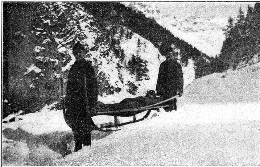
Transport à bras sur terrain accidenté

improvisé, table d'examen (par exemple pour la radiographie) ou même — élevé à hauteur convenable — comme table