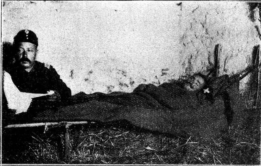
Le brancard sur skis, utilisé comme lit ou comme chaise-longue

brancard-traîneau du Dr Poul, empruntées à notre confrère Das Rote Kreuz (n os 7 et 8, 1918), le modèle préconisé par le