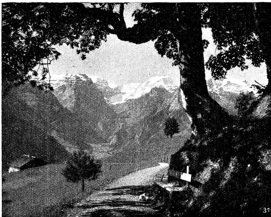
Vue prise de Braunwald: le fond de la vallée de Linthal dominée par le groupe du Tödi.