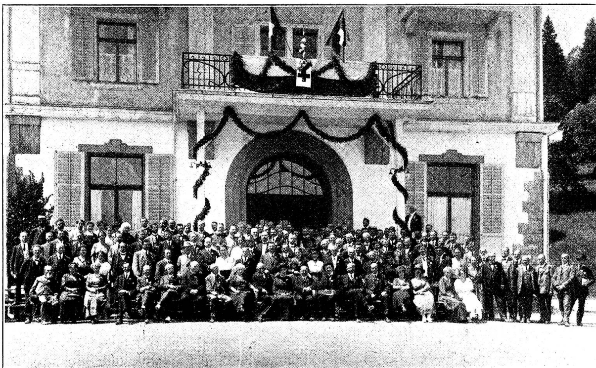
Assemblée générale de la Croix-Rouge suisse, le 26 juin, au Grand Hôtel de Braunwald-Glaris.

M. le D r Guyot (Genève) demande que les nouveaux statuts accordent la faculté aux sections de réunir sur un seul délégué la totalité des voix à laquelle cette sec-