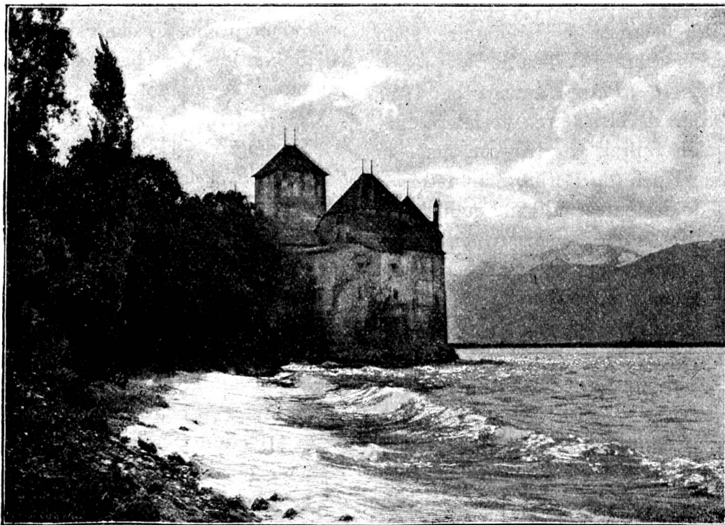
Château de Chillon.

9 h. 15: Assemblée des délégués à la Salle des Chevaliers.