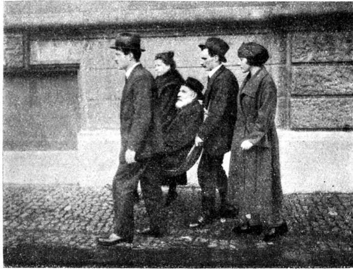
Fig. 4. Transport à trois porteurs au moyen du sac.

nière que le bâton soit placé sous les genoux du patient (fig. 3).