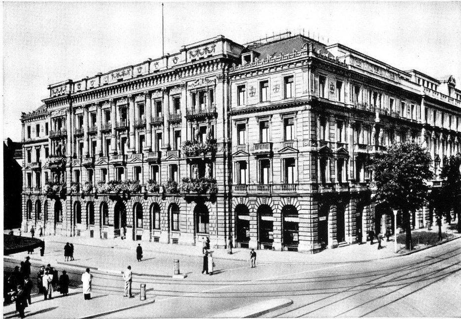
Hôtel de la Banque à Zurich