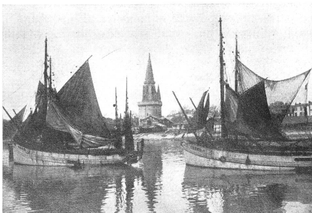
Le port de la Rochelle

La Croix-Rouge suisse est heureuse d'avoir pu collaborer avec la Croix-Rouge française, la Croix-Rouge italienne et les villes de Zurich, Berne et Neuchâtel, en vue de procurer des vacances au bord de la mer à environ cent enfants de chez nous, contribuant ainsi à les rendre plus robustes au seuil de leur semestre d'hiver. Elle forme le vœu que de pareils échanges puissent à nouveau être réalisés l'an prochain, et sur des bases encore plus larges, pour le plus grand bien moral et physique de nos enfants.