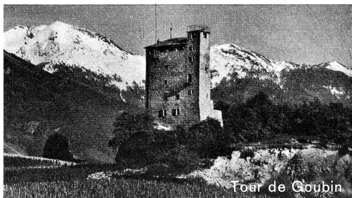
Tour de Goubin

Nous espérons que les délégués et amis de la Croix-Rouge suisse répondront en très grand nombre à l'invitation cordiale que leur adresse la section de Sierre et environs.