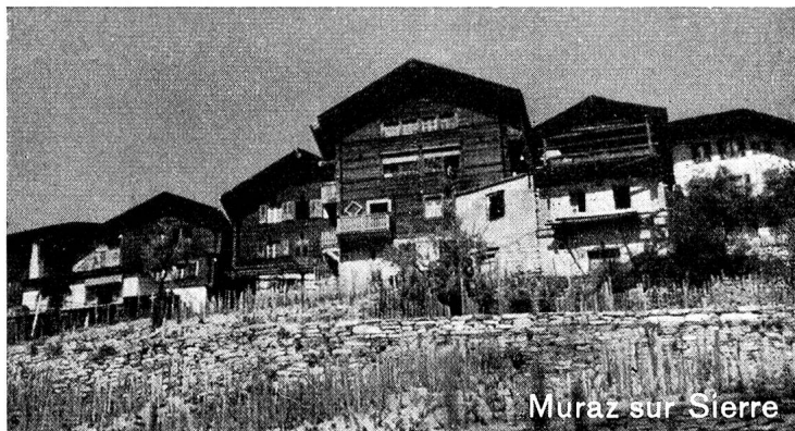
Muraz sur Sierre