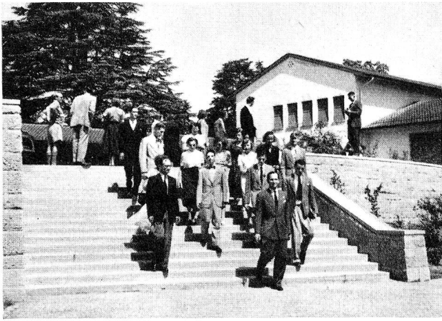
Les Juniors américains visitent le nouveau centre scolaire Trembley, qui est évidemment à l'opposé d'un building puisqu'il ne comprend que deux étages et s'étire largement dans une magnifique campagne aux arbres séculaires.

les chants de leurs pays, le moyen d'unir leurs pensées et de témoigner de leur reconnaissance et de leur attachement à cette Croix-Rouge qui crée l'union par-dessus toutes les divisions. Ces chants ont suffi. Ils ont été beaucoup plus expressifs que n'importe quel discours.