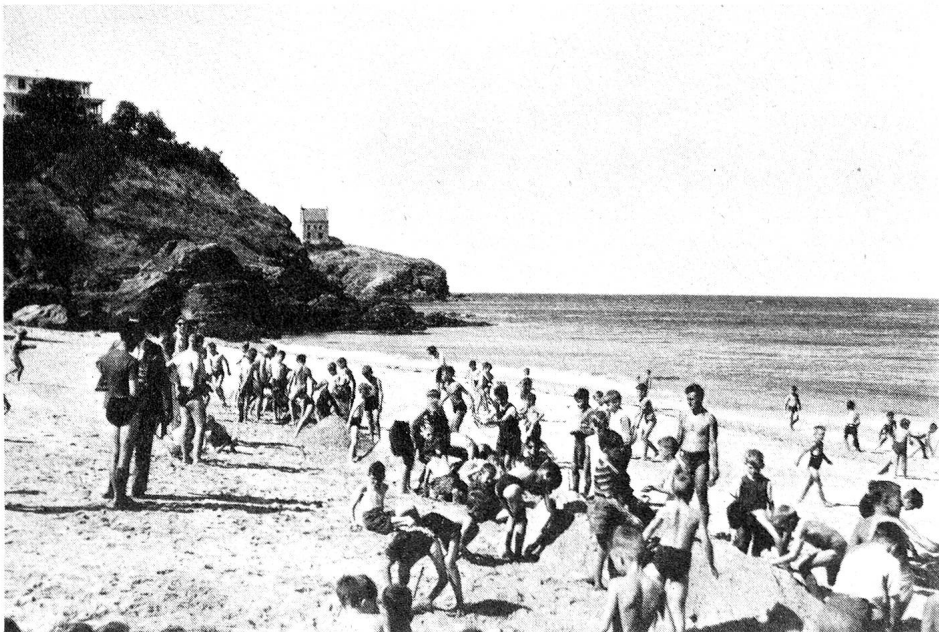
Sur la plage de Belle-Ile, les garçons sont occupés à un concours de forteresses: répartis en équipes, ils édifient des tas de sable aussi hauts et aussi solides que possible, des «forteresses», sur lesquelles chaque équipe placera ensuite un petit drapeau. Lorsque la marée montera, l'équipe victorieuse sera celle dont le drapeau flottera le plus longtemps!

C'est ensuite la vie dans la colonie, où les journées sont si bien remplies et où tout est si nouveau et si merveilleux! Les jeux sur la plage, la pêche aux crabes dans les rochers,