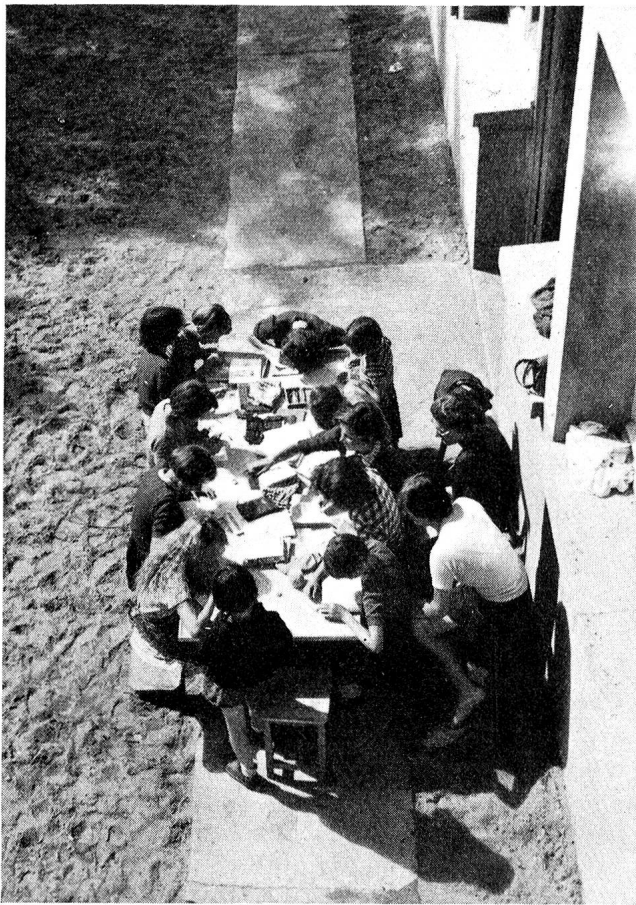
Dans cette autre colonie, également aux Sables-d'Olonne, ce sont des fillettes de Genève et Neuchâtel que nous voyons ici en train d'écrire à leurs parents.

tourne vers lui un visage livide dans lequel brillent deux yeux vitreux, et répond entre deux hoquets: «Je ne croyais pas que c'était si beau, la mer...»