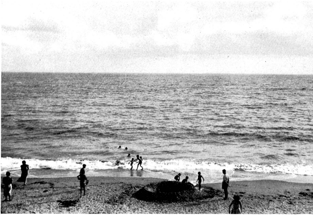
La Tranche-sur-mer, en Vendée. L'heure du bain.