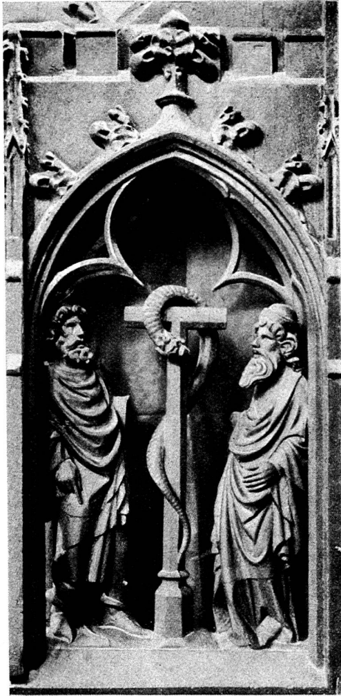
Erection du serpent d'airain, Salzwedel (XIVe siècle).