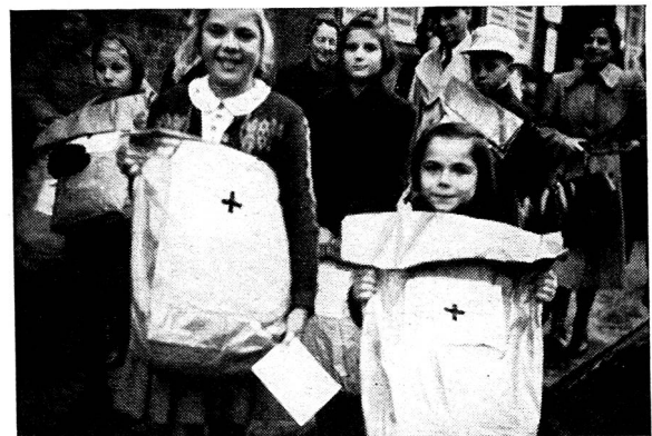
En sortant de la distribution des colis à Rendsburg

Les autres enfants sont venus, une fillette, les deux garçons, des jumeaux de dix ans, le bébé, une belle fillette. Sur la table il y avait