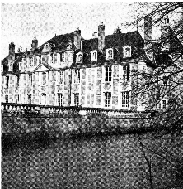
Le centre du château de Serigny.

Les indications de l'examen d'orientation professionnelle (passé préalablement à l'admission en post-cure ) sont confirmées ou infirmées. Dans ce dernier cas, une nouvelle orientation est recherchée, en accord avec le candidat. La récupération scolaire, par les méthodes actives adaptées aux adultes, occupe les heures de travail et prépare directement à l'apprentissage du métier choisi dont les gestes de base sont enseignés.