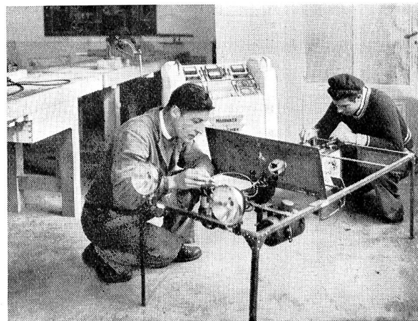
Au centre de Peyrieu (Ain), l'atelier d'électricité-auto.

Il ne faut pas se dissimuler l'intérêt que présente une telle expérience prise et réalisée sur le terrain cantonal et dans de telles conditions. Qu'elle puisse servir de base à d'autres réalisations cantonales en Suisse comme à un texte de loi définitif à Genève dans les années qui viendront, c'est le souhait qu'il faut faire. Car ce n'est qu'ainsi que l'on peut espérer voir se formuler et se préciser une manière de loi type susceptible de s'imposer peu à peu en Suisse, chaque canton la modifiant et l'adaptant selon ses données et conditions particulières, sans créer de nouvelles centralisations et sans nous faire courir de dangereuses aventures financières dont ceux qu'il faut aider seraient fatalement les premières victimes.