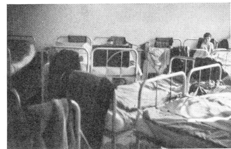
Camp Henri Dunant: un des dortoirs.

Tous ceux qui ne reçoivent pour toute assistance, comme les chômeurs, comme les réfugiés, que quelque 80 marks de secours par mois, quelque 75 ou 80 francs suisses. La vie est elle meilleur marché à Berlin qu'en Suisse? Elle nous le paraît certes de prime abord, sinon pour quelques denrées comme le tabac ou le café. L'inflation a su être évitée, la leçon de 1918 et de la valse funambulesque et tragique des milliards, des billions et des trillions des marks d'alors, n'a pas été perdue. Le pennig garde sa valeur mieux que centime de Suisse ou franc de France, et l'on mange bien pour 2 marks et demi ou