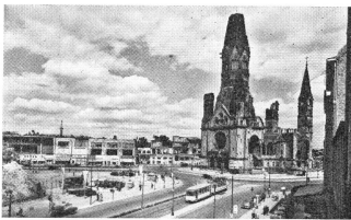
Les ruines de l'église du Souvenir de l'empereur Guillaume et le Kurfürstendamm.

devenit un parc où les nouvelles plantations d'arbres et les avenues se dessinent à nouveau. Le Zoo a retrouvé son calme et ses visiteurs ainsi que ses bêtes, et l' Aquarium ses cuves et l'admirable joaillerie des poissons exotiques. Des broyeuses géantes réduisent en poussière des millions de briques écornées ou cassées des bâtiments détruits que leur amènent d'innombrables camions, et leur poussier clair s'amorce en gigantesques collines où se dessinent déjà les allées et les bosquets des parcs futurs de la grande ville de demain.