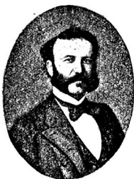
Henri Dunant. Nach der einzigen vorhandenen Photographie vom Jahr 1864.