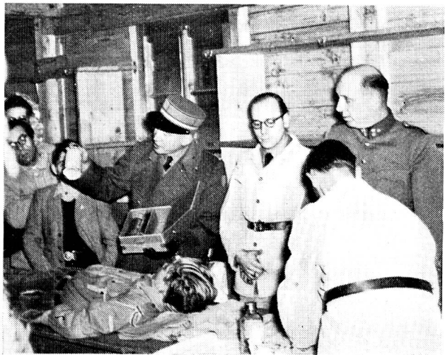
Un exercice régional: la critique.

Le Groupement régional romand est composé de six sections: Genève, Lausanne, Fribourg, Payerne, Vevey et Yverdon. L'activité de ces sections est encourageante, malgré la difficulté de recrutement qui se fait surtout