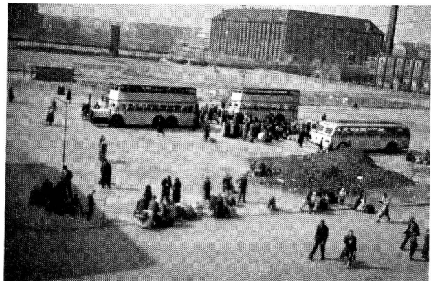
Dans la cour du même camp, les autobus sans cesse chargent les réfugiés appelés à gagner l'Allemagne occidentale et les conduisent à Tempelhof.

J'ai vu aussi ces Kindergärten, ces jardins d'enfants dont la Croix-Rouge suisse, grâce à ses parrainages a équipé plusieurs, et que, partout où on le peut, on a créés pour enlever les enfants de la vie et la triste promiscuité des camps. J'ai vu ces infirmeries si propre et leurs médecins et leurs infirmières, ces réserves immenses de draps, de couvertures, de vêtements, de gamelles et de services à manger remis aux réfugiés contre bon dès leur arrivée, ces magasins de jouets, même, et cet atelier où par centaines l'on répare poupées, magasins, trottinettes, et les repeint de frais pour les prêter aux enfants qui, s'ils les soignent bien, pourront les garder.