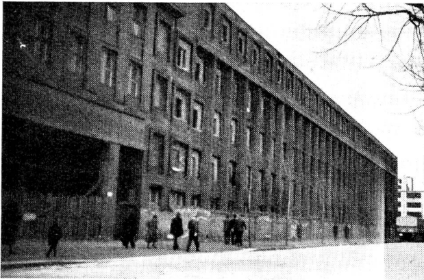
Dans cet immense bâtiment, non loin de Tempelhof, 4000 à 5000 réfugiés attendent de pouvoir quitter Berlin. Sans cesse de nouveaux arrivants longent le trottoir pour gagner l'entrée du camp ou bout de la rue.

des arrivées oblige de serrer et serrer encore, pour que tous au moins aient un toit et aient un lit; une, deux, trois familles dans cette chambre, douze, quinze, vingt dans cette plus vaste pièce, 70, 80, 100 dans cette halle froide ou ce vaste magasin, lit contre lit, sans qu'il y ait place même pour plus d'une table ou deux. C'est 2 m 2 peut-être, la moyenne d'espace vital de chaque être humain, 4 à 5 m 3 au maximum l'air qui lui est concédé, pour dormir, pour manger, pour penser 24 heures sur 24. Tous les locaux d'usage commun, réfectoires, salles de lecture, ont dû se transformer en dortoirs eux aussi. Il reste l'infirmerie, les vestiaires, les cuisines, les salles où se laver rapidement, et puis, habituellement, une minuscule cuisine avec deux réchauds ou trois dont l'usage n'est permis qu'aux seules mères de jeunes enfants et où l'on s'entasse aussi aux heures des bouillies ou des biberons.