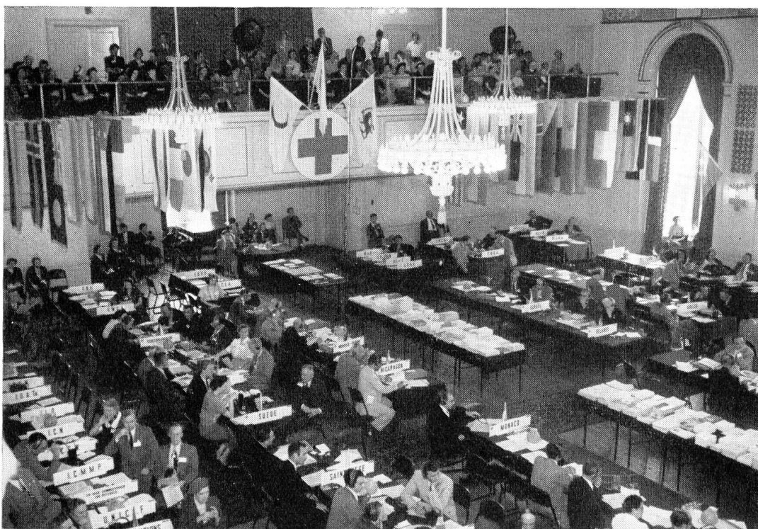
Vue de l'Assemblée plénière de la XVIII e Conférence internationale de Toronto.

C'est ainsi que, jour après jour, la Conférence a dû entendre les accusations les plus graves sur des violations alléguées du droit de la guerre et des Conventions de Genève dans le conflit de Corée, et notamment sur l'emploi qu'auraient fait les troupes des Nations-Unies de l'arme bactérienne. Loin de nous la pensée que la Croix-Rouge doit fermer les yeux devant les horreurs de la guerre et rester inerte devant des violations établies qui ne font qu'aggraver ces horreurs. Tout au contraire, la Croix-Rouge doit voir les choses en face. Elle doit se préoccuper des misères provoquées par la guerre, au besoin les stigmatiser: mais dans le seul dessein d'en secourir les victimes et, si possible, d'en éviter le retour. Jamais pour attiser la haine. Or ceux qui, à Toronto, lançaient accusations sur