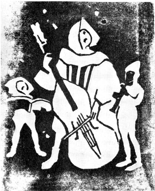
Dans le cadre de la Conférence, une exposition internationale de dessins de «juniors» avait été organisée à Toronto. «Aubade», ce lino d'un collégien genevois de 14 ans y a figuré.

C'est ainsi que, jour après jour, l'on vit porter à la tribune toute une série d'attaques calomnieuses contre le C. I. C. R. Ces attaques étaient sans fondement et le C. I. C. R. n'eut pas de peine à les réduire à néant dans un mémoire distribué à toutes les délégations. Elles tendaient toutes à suspecter son impartialité. En les lançant à propos de la demande qui avait été adressée au C. I. C. R. d'enquêter sur l'emploi allégué de l'arme bactérienne en Corée, leurs auteurs ne montraient que trop qu'en réalité ils craignaient l'impartialité tout court, jugée par eux politiquement indésirable. Or, l'impartialité n'est pas l'apanage du C. I. C. R. C'est un principe de base de toute la Croix-Rouge. C'est donc, à travers le C. I. C. R., la Croix-Rouge dans son ensemble, et ses possibilités d'action, qui étaient en danger. La grande majorité de la Conférence le comprit et, par des votes massifs, proclama sa confiance dans le C. I. C. R. et repoussa les propositions de la dernière heure qui tendaient, dans les projets de Statuts révisés, à