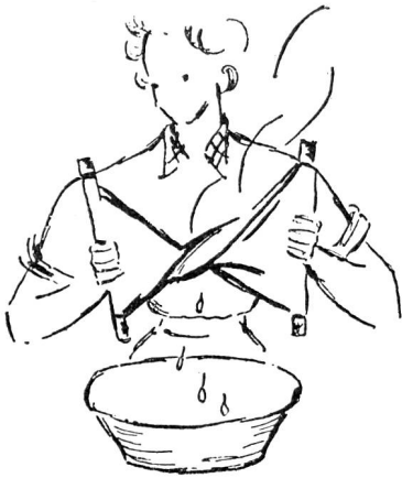
Préparation d'une compresse chaude. (Manuel de soins au foyer de la Croix-Rouge allemande.)