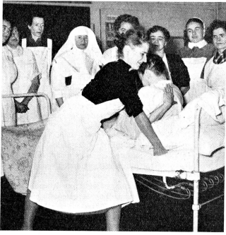
Comment assister le malade. Cours de soins au foyer donné à Lausanne.

récapitulation des matières enseignées au long du cours.