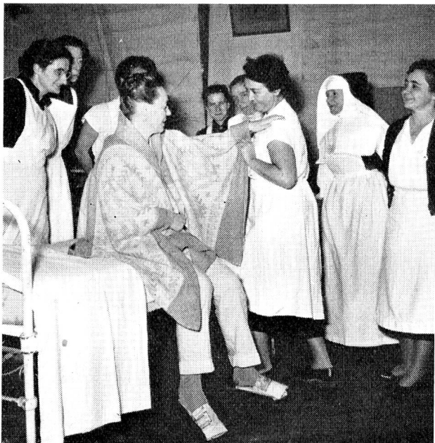
Confection d'une robe de chambre improvisée.