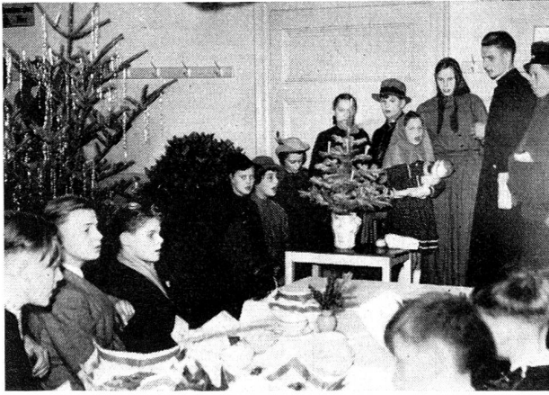
A la distribution des colis suisses de parrainage à Rastatt, des groupes de la Croix-Rouge locale de la Jeunesse sont venus apporter leurs chants de Noël.

tous les enfants du camp ont été invités par des troupes d'aviation américaine stationnées à proximité, et à chacun, après un goûter, «Santa Claus» a offert un cadeau. Seulement, au retour, ils ont retrouvé cette usine et son campement. Et cette terrible promiscuité où ils sont contraints jour et nuit.