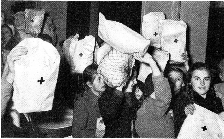
La Croix-Rouge allemande s'occupe activement du sort des réfugiés. Voilà une distribution de vêtements faite par ses soins à des enfants réfugiés au Wurtemberg.

Mais cette Allemagne-là a dû et doit encore et sans cesse faire face à de graves problèmes économiques et sociaux et à de nouveaux afflux de réfugiés démunis d'absolument tout. Et ce problème est d'autant plus grave pour l'Alle-