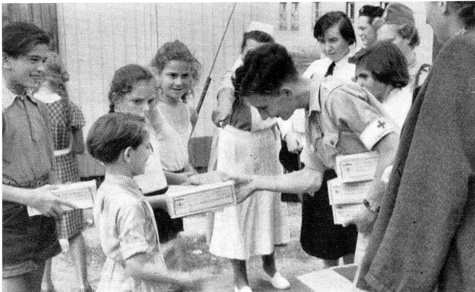
La Croix-Rouge de la Jeunesse américaine a envoyé aux enfants réfugiés des boîtes-cadeaux que les «juniors» allemands ont été distribuer dans les camps.

La nuit était tombée sur Karlsruhe. J'ai laissé mes compagnes repartir vers Stuttgart par les routes verglacées et neigeuses, et reprendre dès le matin le lendemain, à Ulm, ailleurs encore, leurs distributions des colis suisses de parrainages à d'autres enfants réfugiés. Un train de nuit m'a ramené en Suisse. Par les