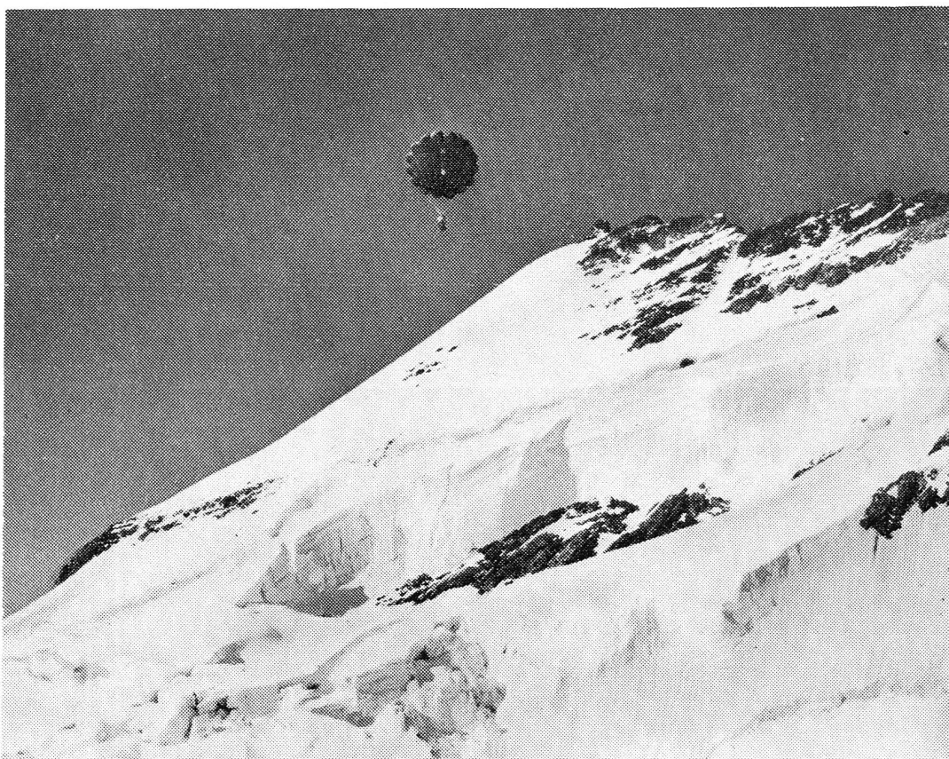
Un saut hardi en parachute sur le glacier.

I. — Schaffhouse - Zurich - Weesen - Glaris - Sargans - Coire - Davos - Pontresina;