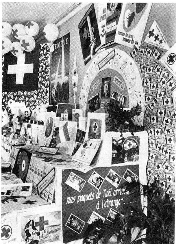
L'exposition organisée par les «juniors» à Bertrange.

Partagés en trois équipes, et deux d'entre elles virent des représentants romands élus à leur tête, les «juniors» réunis au Camp de Bertrange se livrèrent à de nombreux travaux pratiques — secourisme, confection d'albums, préparation d'une exposition croix-rouge, rédaction du journal du camp, travaux manuels, etc. C'est là un excellent encouragement au développement chez nous des groupes de «juniors» croix-rouges.