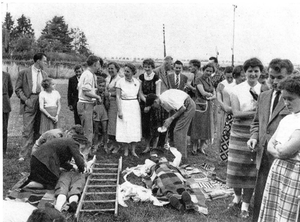
A Bertrange, entraînement et démonstrations de secourisme par les «juniors» participant au centre international d'études.