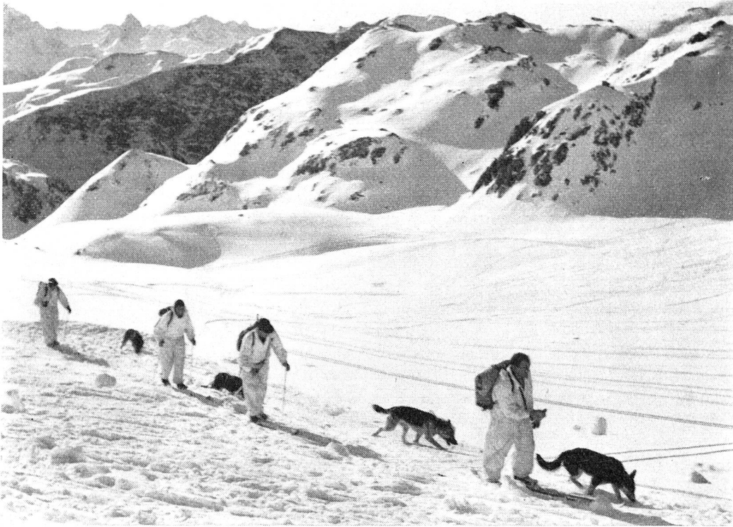
Un cours de conducteurs et de chiens d'avalanches.

par deux hommes, soit muni d'une roue; le «traîneau Akja», en aluminium, couramment utilisé en Autriche ou en Allemagne, un peu plus lourd que la «canadienne» classique (13 à 14 kg au lieu de 10), mais qui a l'avantage de pouvoir être transporté en deux parties au lieu de l'accident et, conduit par deux skieurs voire par un seul, de protéger le blessé de la neige grâce à ses bords relevés, et que l'on peut également placer sur un léger chariot à une roue; le «téléphérique» enfin, selon le modèle que possède déjà notre armée, et qui avec ses trois câbles porteurs de 100 m de long, son câble tracteur