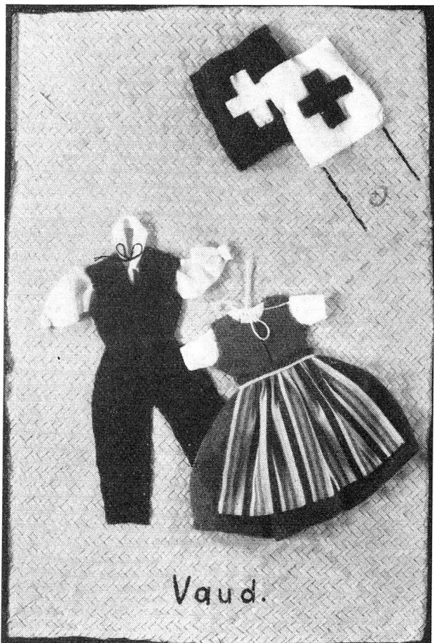
Répondant à une demande de «juniors» du Nicaragua, les élèves de l'Ecole ménagère d'Aubonne ont confectionné ces ravissants costumes vaudois.

Genève: Ecoles de Carouge (école Jacques Dalphin), Châtelaine, Collex-Bossy, Collonge-Bellerive, Cointrin, Meyrin, Pinchat, Vézenaz; Ville de Genève: écoles primaires de la rue de Berne, des Crêts (Petit-Saconnex), des Eaux-Vives, du Mail, de Malagnou, du Parc Bertrand, de la rue de Neuchâtel, des Pâquis, des Pervenches et de la Servette, Maison des enfants sourds, Ecole ménagère et Ecole supérieure de jeunes filles.