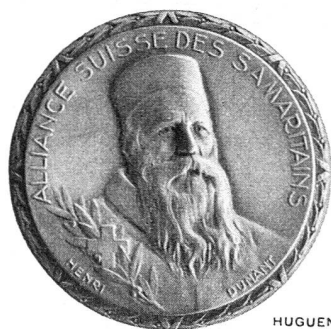
HUGUENIN LE LOCLE

nombrables missions pour la Croix-Rouge suisse et le Secours suisse de 1940 à 1947 (Finlande, France, Allemagne, Buchenwald) appelaient cette consécration.