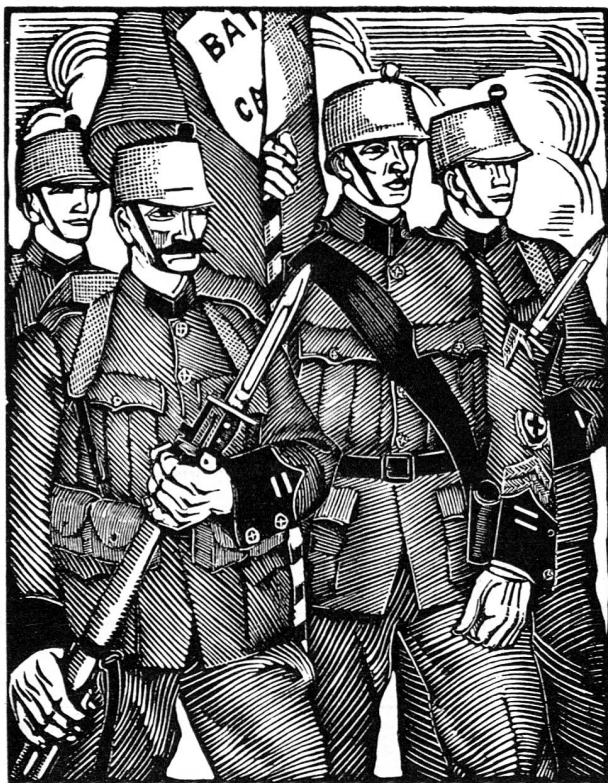
L'armée suisse de 1914 était déjà bien différente de celle de 1871... (Bois de H. Meylan.)

Cette évolution a modifié si complètement les conditions «matérielles» de la guerre, que la tactique et la stratégie elle-même, et leurs lois lentement fixées, s'en sont trouvées, sinon bouleversées, du moins profondément modifiées. Parallèlement à cette évolution des moyens mis en jeu, deux autres phénomènes ont contribué à précipiter la transformation de la guerre en guerre totale.