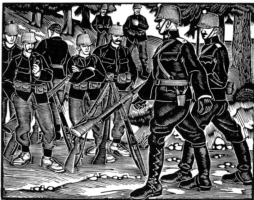
Au cours des trois dernières guerres, la Confédération suisse a pu préserver la paix de ses habitants et l'intégrité de son territoire... (D'après un bois de H. Meylan.)

dernes. La dotation en moyens de feu d'un simple bataillon contemporain ne peut guère être comparée qu'à celle d'une brigade, voire d'une division de jadis. La mobilité des troupes est devenue simultanément, du fait de la motorisation puis des possibilités offertes par le transport aérien et le parachutage, un phénomène inconnu au cours de l'histoire militaire.